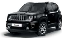
601 Czarny Solid (pastelowy)